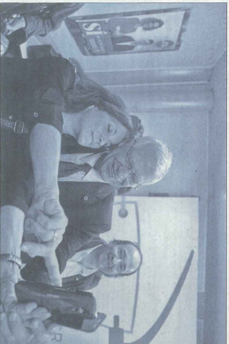
Josep Borrell, durante un acto de las primarias en apoyo a Miguel Iceta (dcha.).